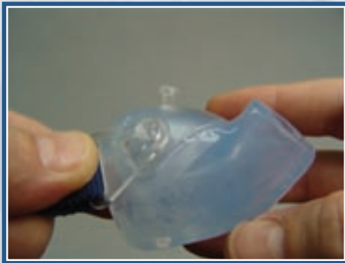
Clip mit der Öse über Kunststoffpils legen

WICHTIG! Von den drei Befestigungsbändern ist ein seitliches Band (siehe Bild unten) mit einem Clip versehen, der in einigen Fällen eine große Öse hat. Dies dient zum erleichterten Aushaken des Bandes.